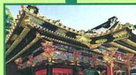
久能山東照宮 Dゾーン 滞在60分