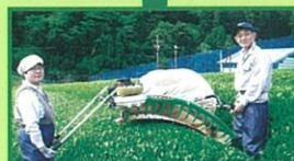
㊿水野製茶 Hゾーン 滞在45分