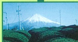
㊟漆畑製茶 Gゾーン 滞在45分