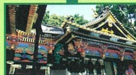
久能山東照宮 Dゾーン 滞在60分