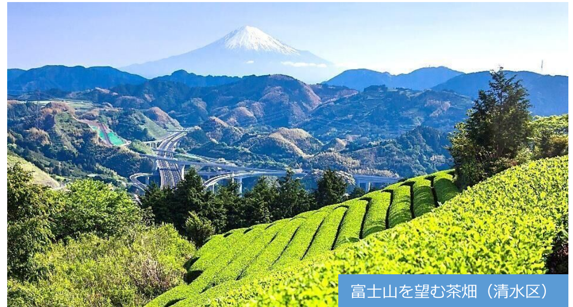
富士山を望む茶畑（清水区）