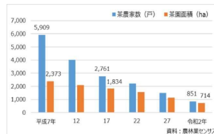
静岡市茶農家数と茶園面積の推移