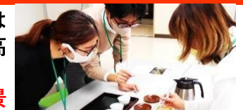
お茶を学ぶ市民向け講座