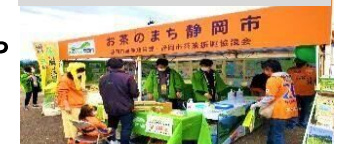
お茶啓発イベント